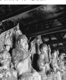
佛教密宗观世音的五方佛