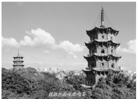
陈那罗刹像舍利塔

五代,中原战乱,而泉州社会安定。王审知家族在闽执政四十年,建寺造塔,铸像写经,设坛度僧,重视法度继承,支持佛教发展。时为五州之一的泉州建有福清寺、崇福寺等34所。王审知侄儿王延彬居士任泉州刺史17年,将泉州的佛教寺院建设推向空前。