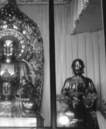
铸造于清顺治年间的铜佛像群,工艺精湛。