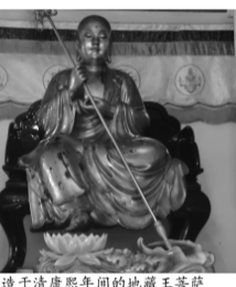
铸造于清康熙年间的地藏王菩萨